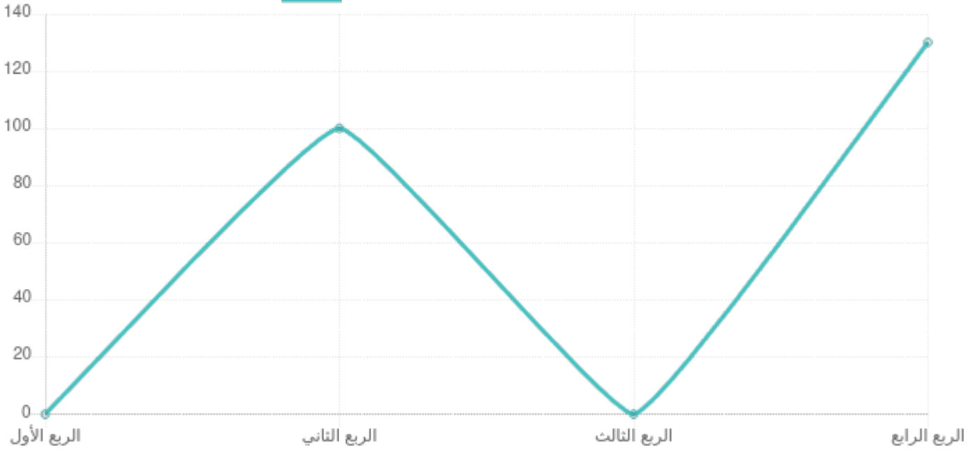
أداء الفترة (قريبة الأمد: 1.2. اسر ممكنة اقتصادياً)