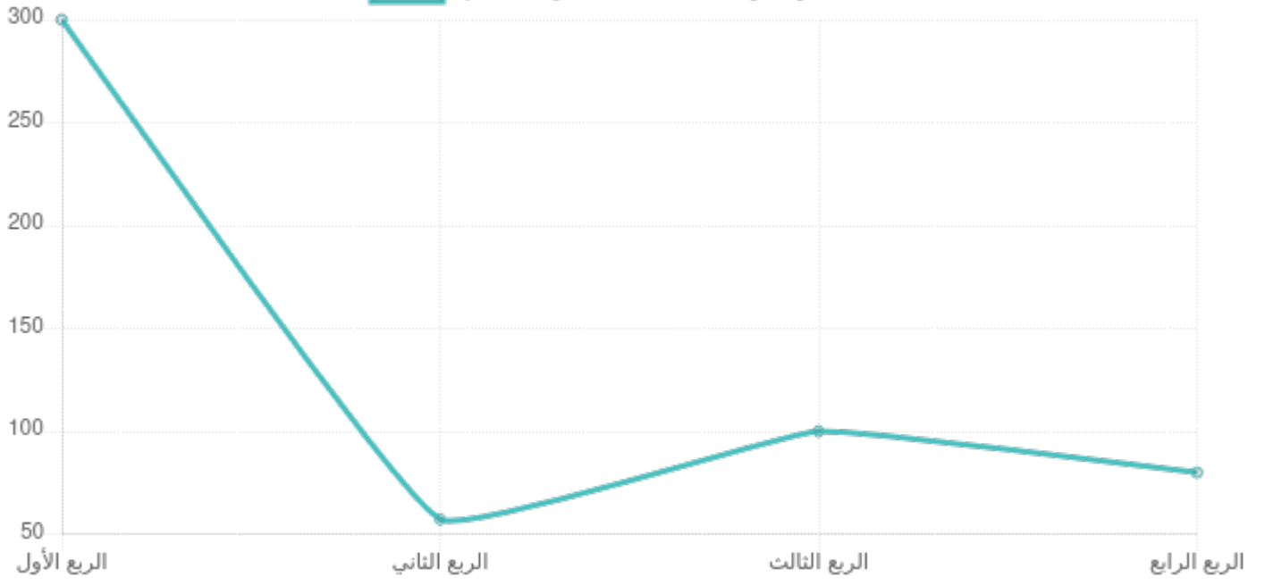
أداء الفترة (قريبة الأمد 2.2: الاستثمار الاجتماعي)